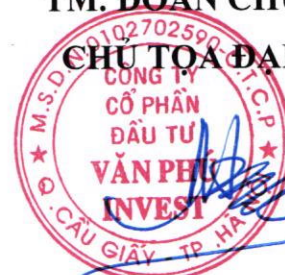
Tô Như Toàn